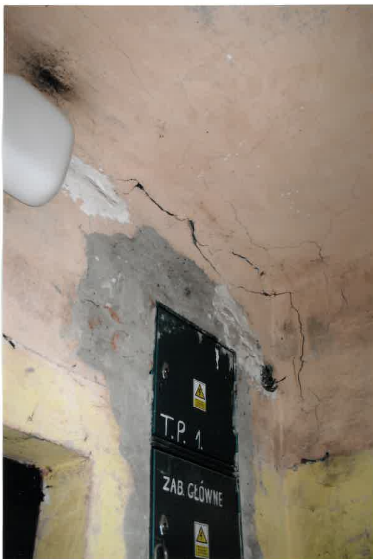
Fot. Nr 22. Pęknięcie ściany i stropu na klatce schodowej.