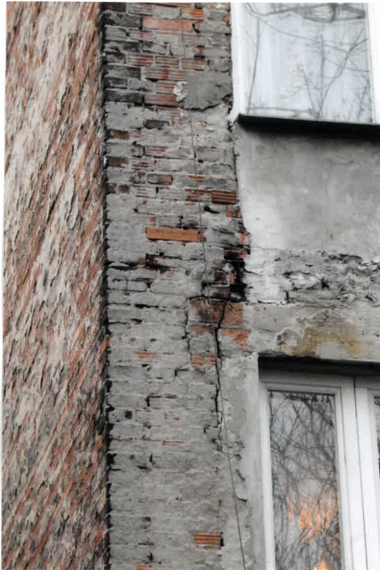
Fot. Nr 54. Widok elewacji od ulicy podwórka z widocznymi pęknięciami pionowymi i szczeliną w ścianie z ubytkiem zaprawy w spoinach pomiędzy ceglami, widoczne ubytki tynku na elewacji.