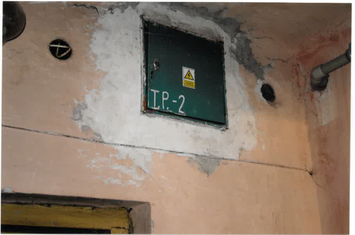
Fot. Nr 23. Pęknięcia na stropie i ścianie na klatce schodowej.