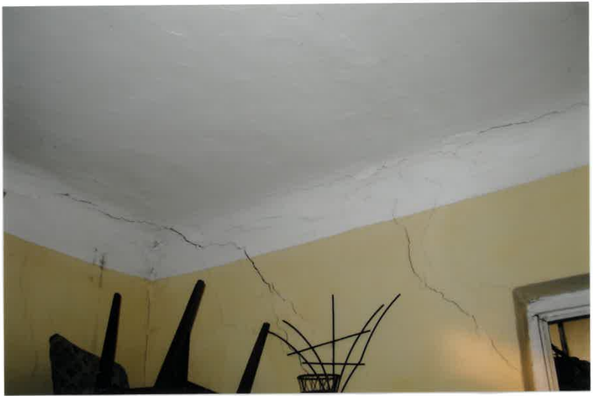
Fot. Nr 41. Pęknięcia na ścianie w narożniku pokoju w lokalu nr 16 na II piętrze.