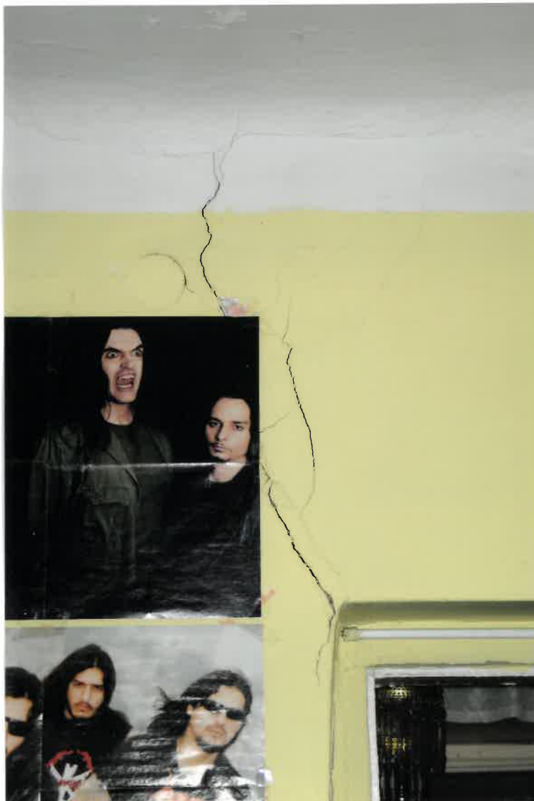
Fot. Nr 32. Pęknięcie ściany lokalu nr 9 na I piętrze.