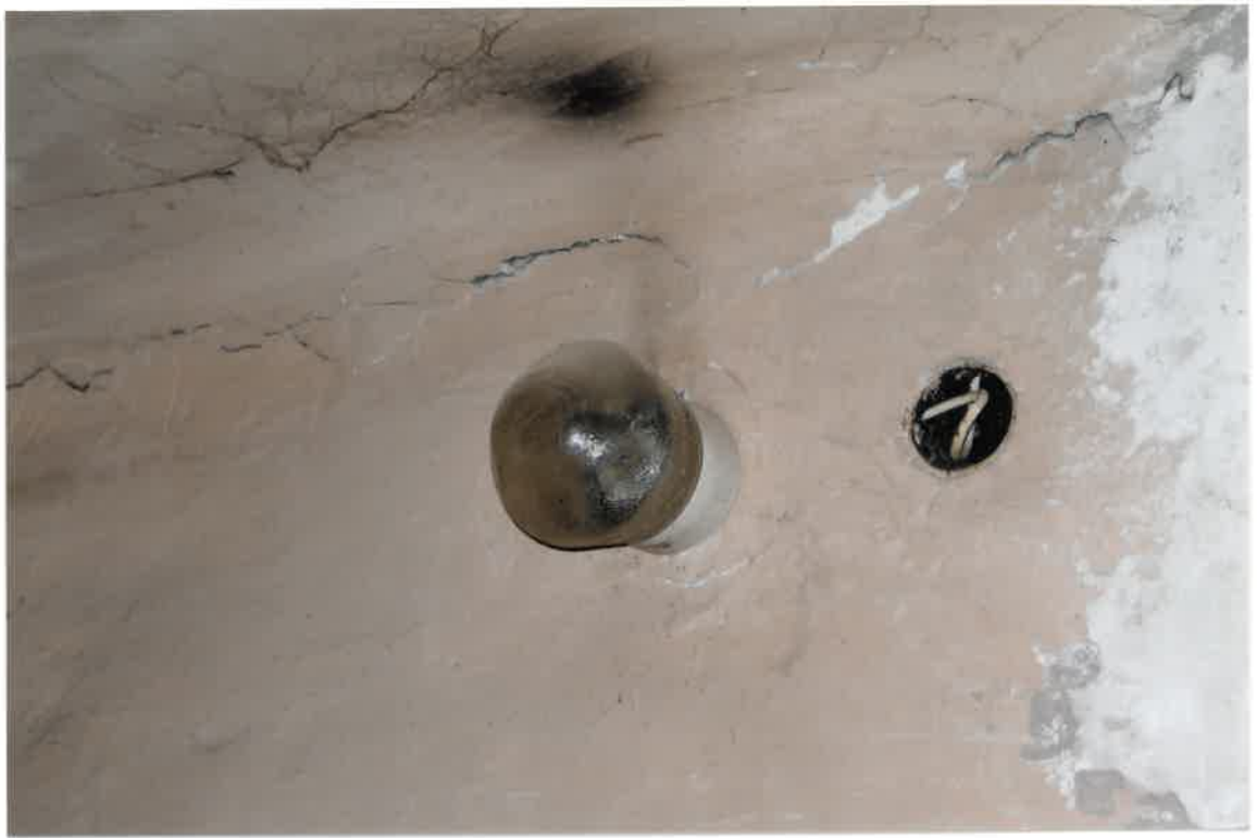
Fot. Nr 25. Pęknięcia ścian pod stropem na klatce schodowej.