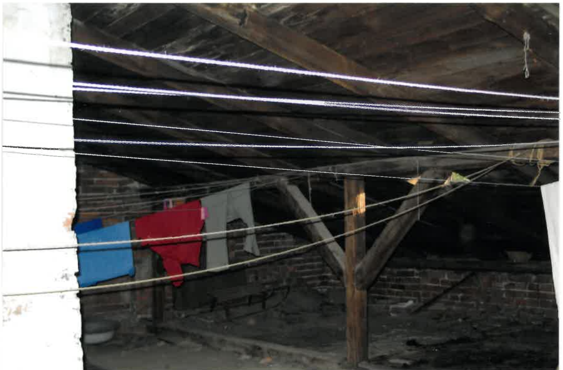
Fot. Nr 48. Widoczne ślady zacieków na deskowaniu spowodowane nieszczelnością pokrycia dachowego.