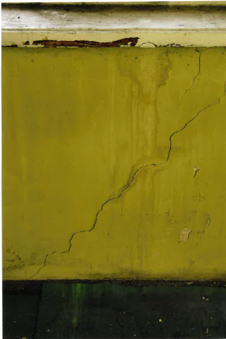
Fot. Nr 2. Pęknięcie ściany