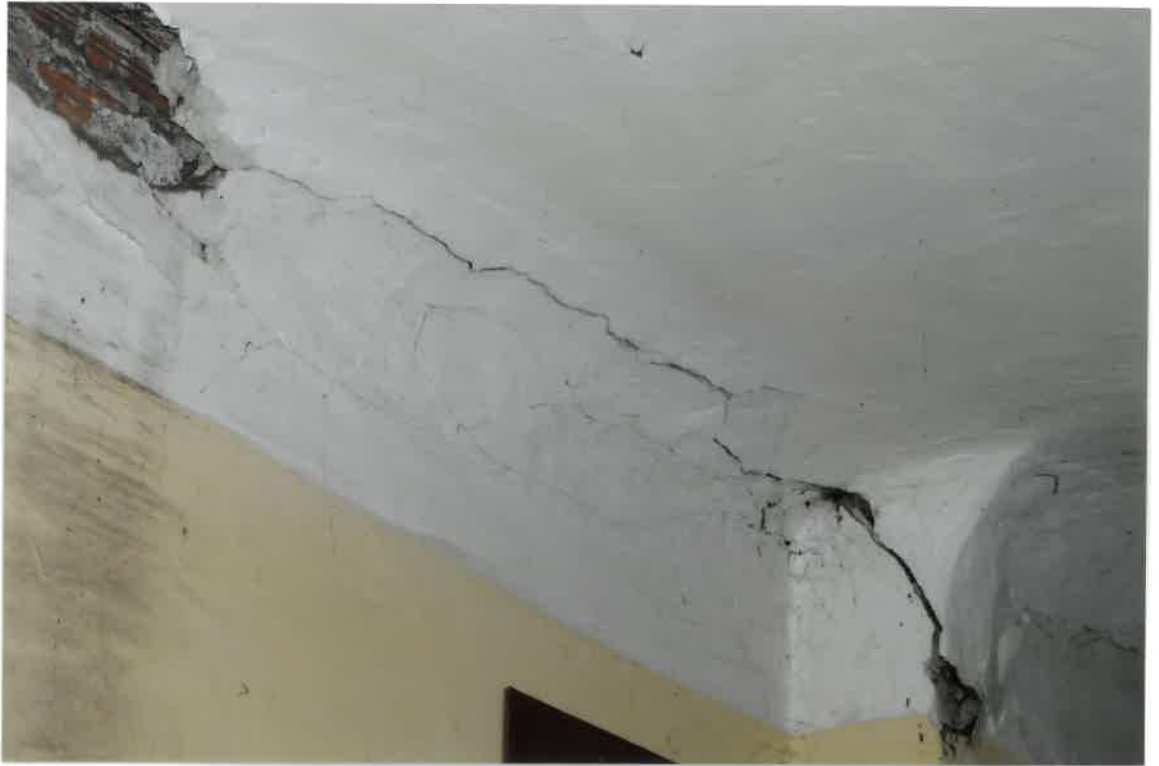
Fot. Nr 43. Pęknięcia w miejscu styku stropu i ściany oraz ubytki tynku w lokalu nr 16 na II piętrze.