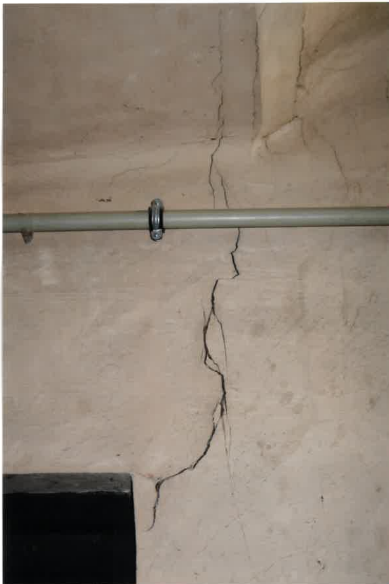
Fot. Nr 24. Pęknięcie ściany na styku ze stropem na klatce schodowej.