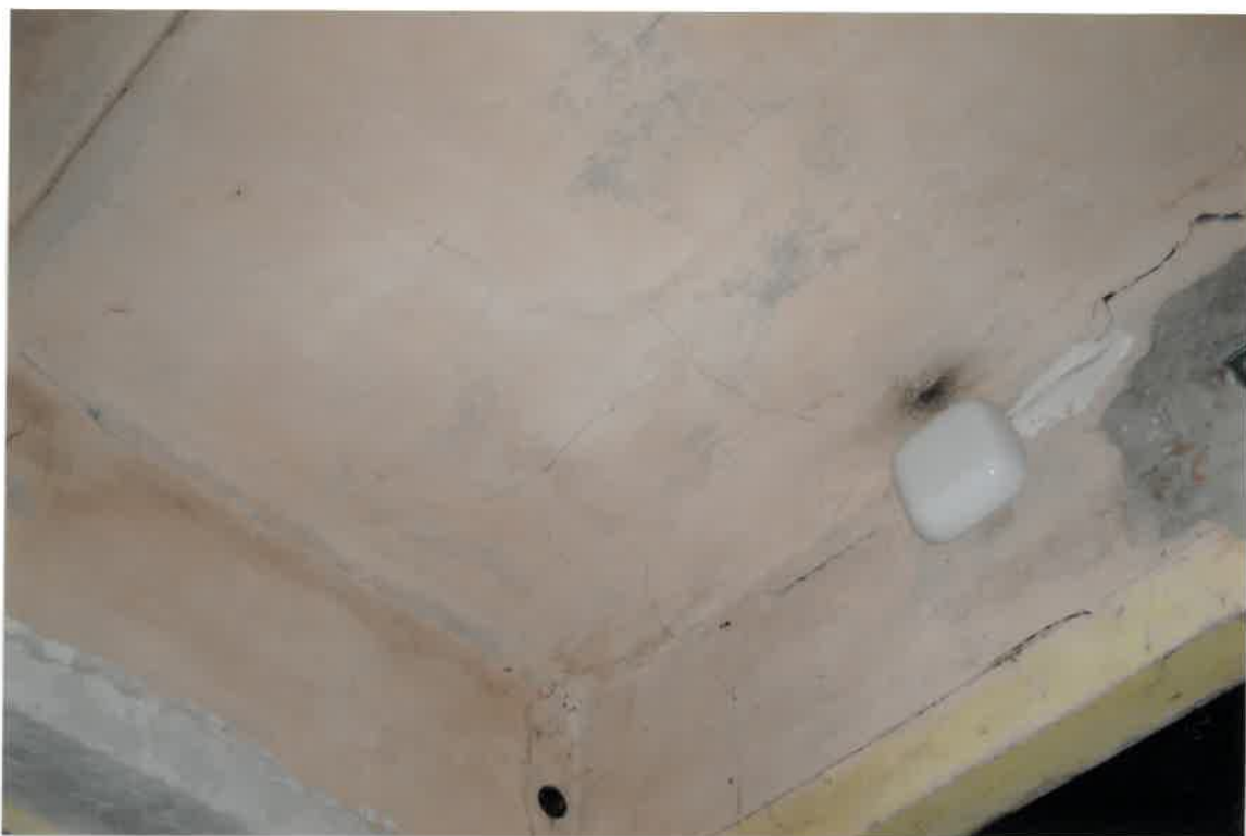
Fot. Nr 21. Pęknięcia na stropie i ścianie na klatce schodowej na parterze.