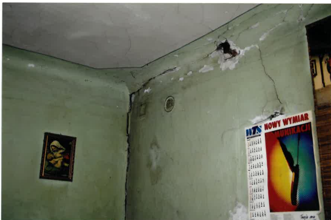
Fot. Nr 38. Pęknięcia ścian i stropu z ubytkami tynku w lokalu nr 16 na II piętrze.