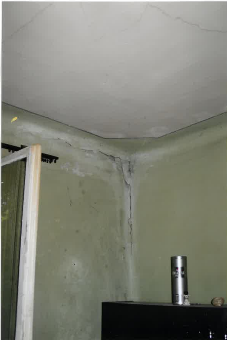
Fot. Nr 44. Pęknięcia na ścianie i na stropie w narożniku pokoju w lokalu nr 16 na II piętrze.