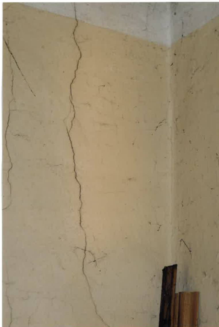
Fot. Nr 8. Pęknięcia ściany w narożniku w lokalu nr 14 na II piętrze.