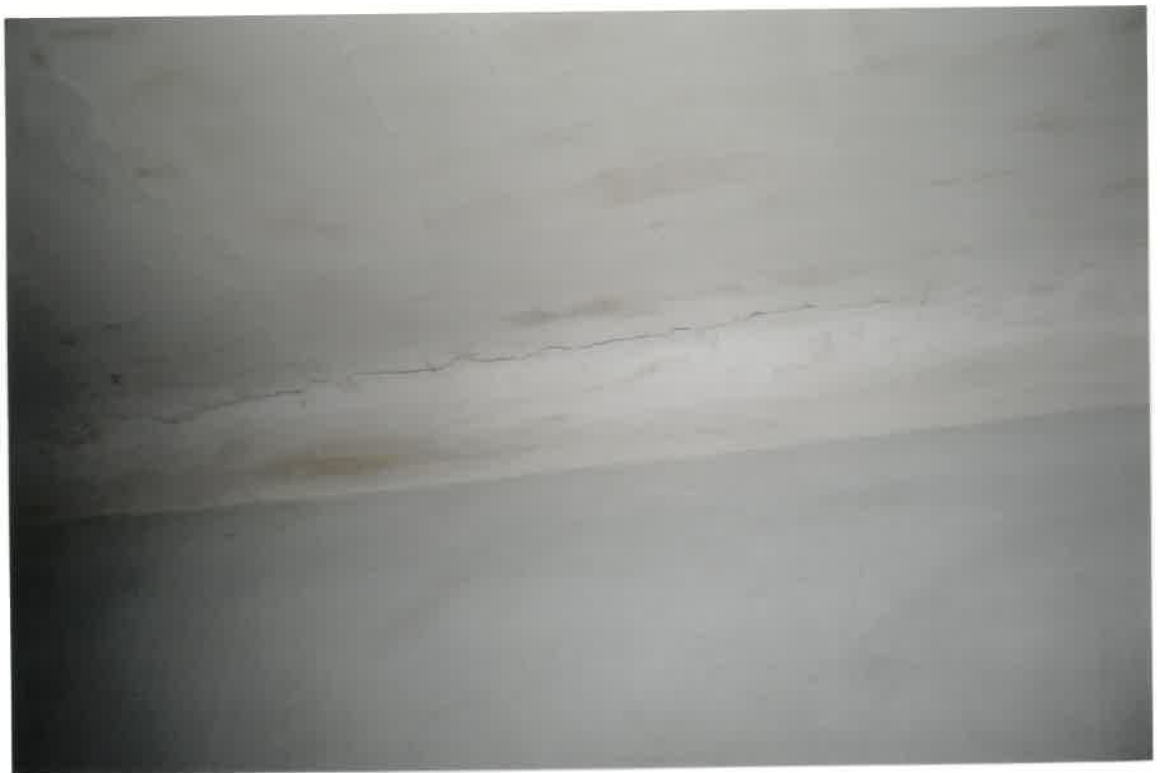
Fot. Nr 16. Pęknięcia na styku stropu ze ścianą w lokalu nr 4/5 na parterze pomieszczenie przy prześwicie budynku.