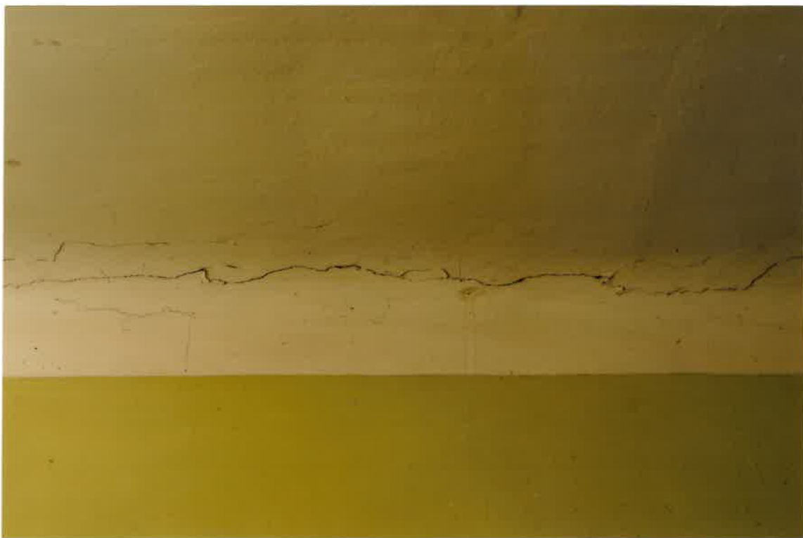
Fot. Nr 3. Pęknięcia tynku w miejscu styku stropu ze ścianą w lokalu na I piętrze.