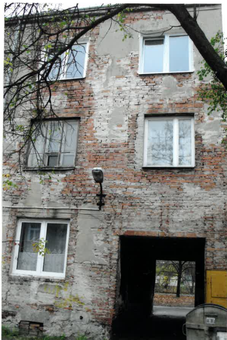
Fot. Nr 49. Widok elewacji od podwórka z widocznym pęknięciem pionowym między oknami i ubytkiem zaprawy w spoinach pomiędzy ceglami, brak tynku na elewacji.