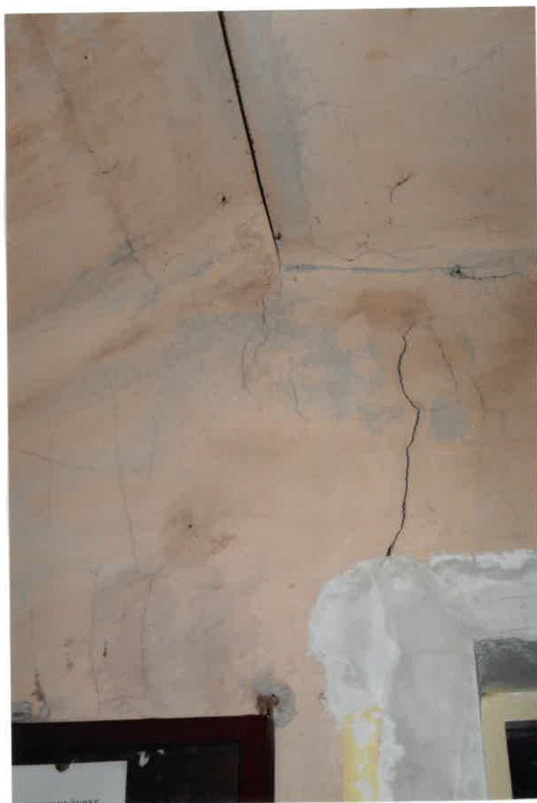
Fot. Nr 20. Pęknięcie ściany na klatce schodowej.