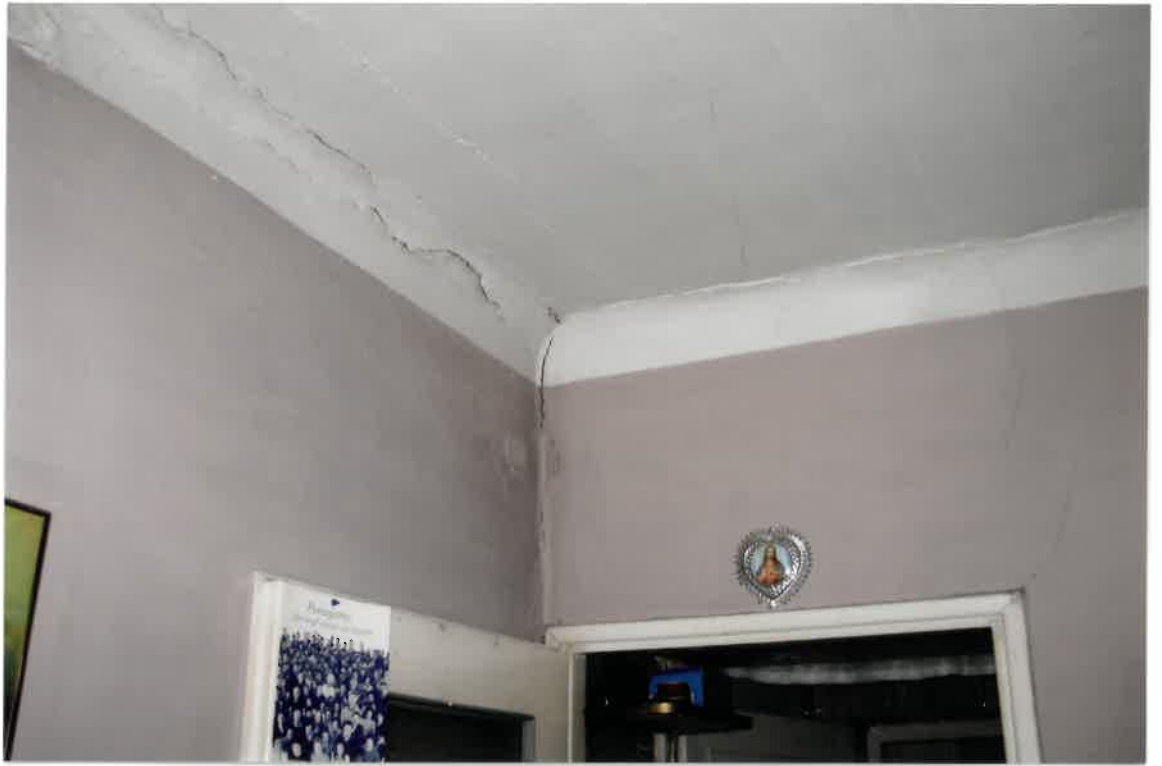
Fot. Nr 31. Pęknięcia w miejscu styku stropu i ściany w lokalu nr 9 na I piętrze.