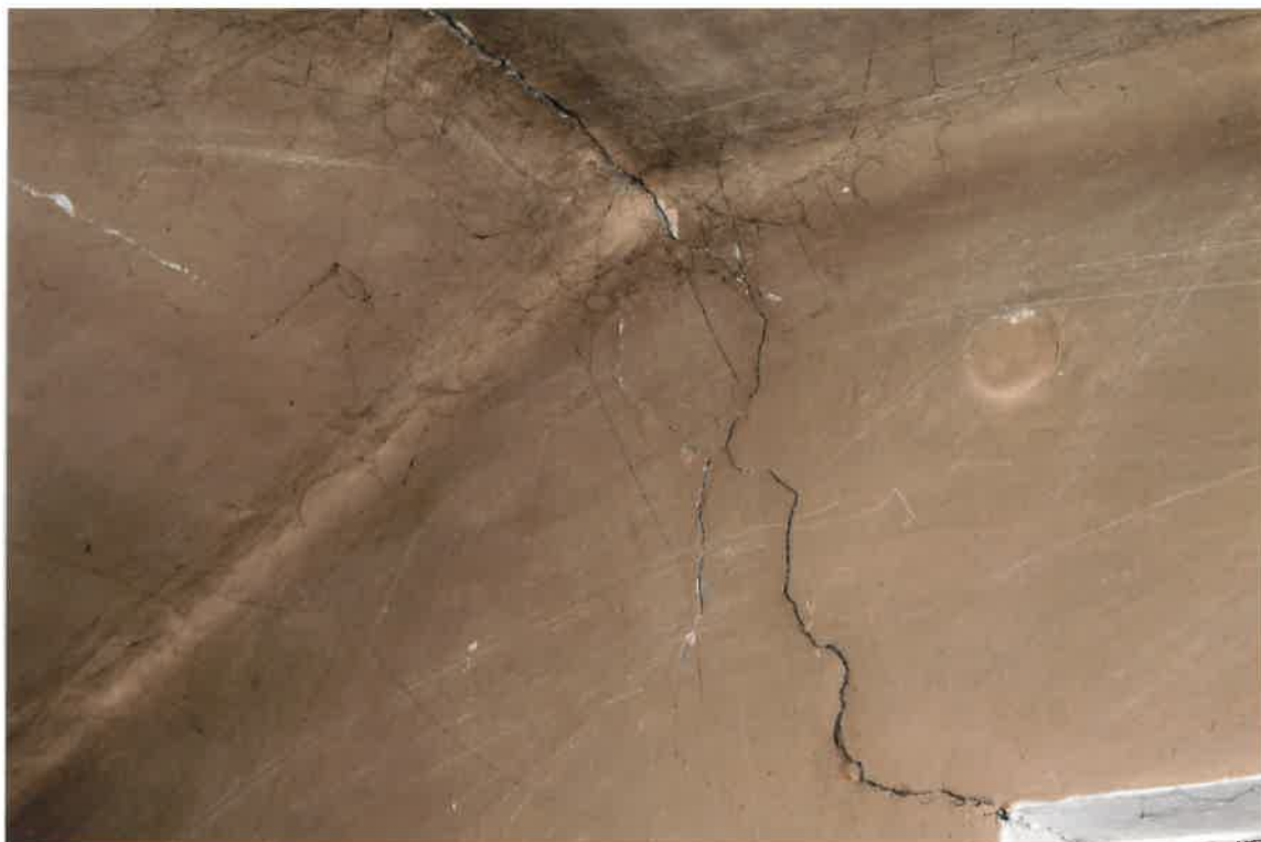
Fot. Nr 37. Pęknięcia na ścianie i stropie na klatce schodowej na II piętrze.