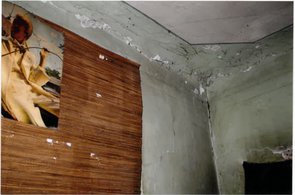
Fot. Nr 39. Pęknięcia na ścianie w narożniku pokoju w lokalu nr 16 na II piętrze.