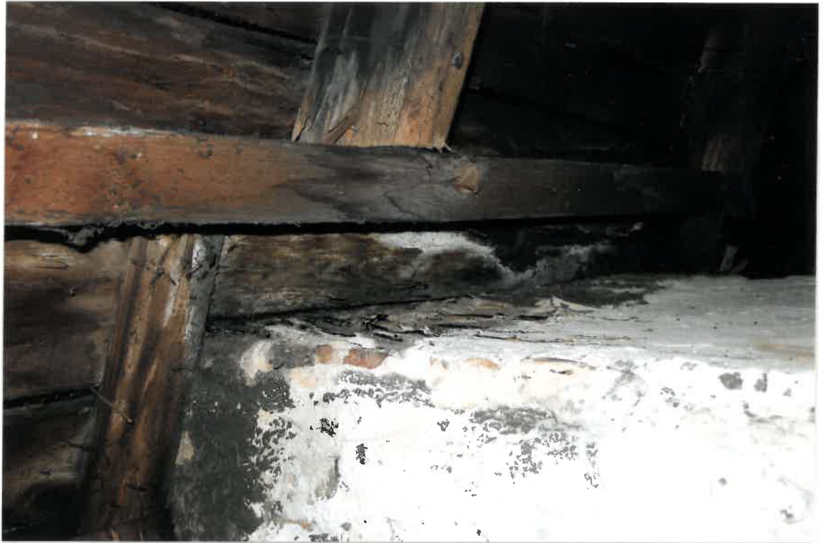
Fot. Nr 47. Drewniana więźba dachowa na skutek zalania jest porażona grzybem domowym przy kominie.