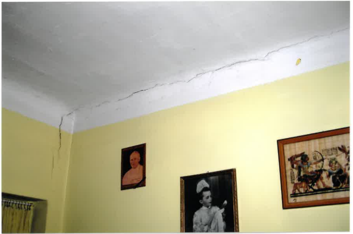
Fot. Nr 29. Pęknięcia stropu łączące się z pęknięciem ściany w lokalu nr 9 na I piętrze.