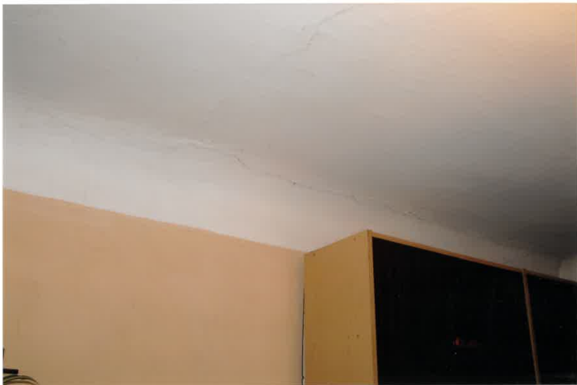
Fot. Nr 17. Pęknięcia na stropie wzdłuż belki stropowej i w miejscu styku ściany ze stropem w lokalu nr 4/5 na parterze.