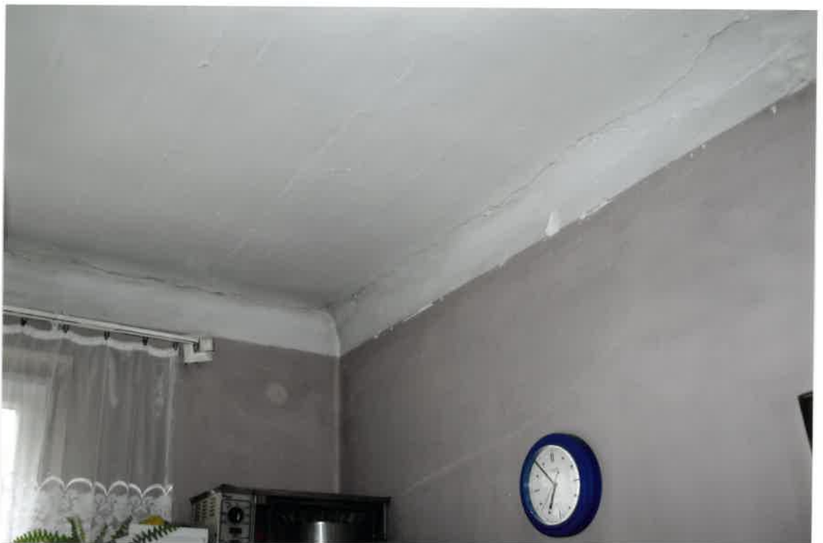
Fot. Nr 34. Pęknięcia na styku stropu ze ścianą w lokalu nr 9 na I piętrze.