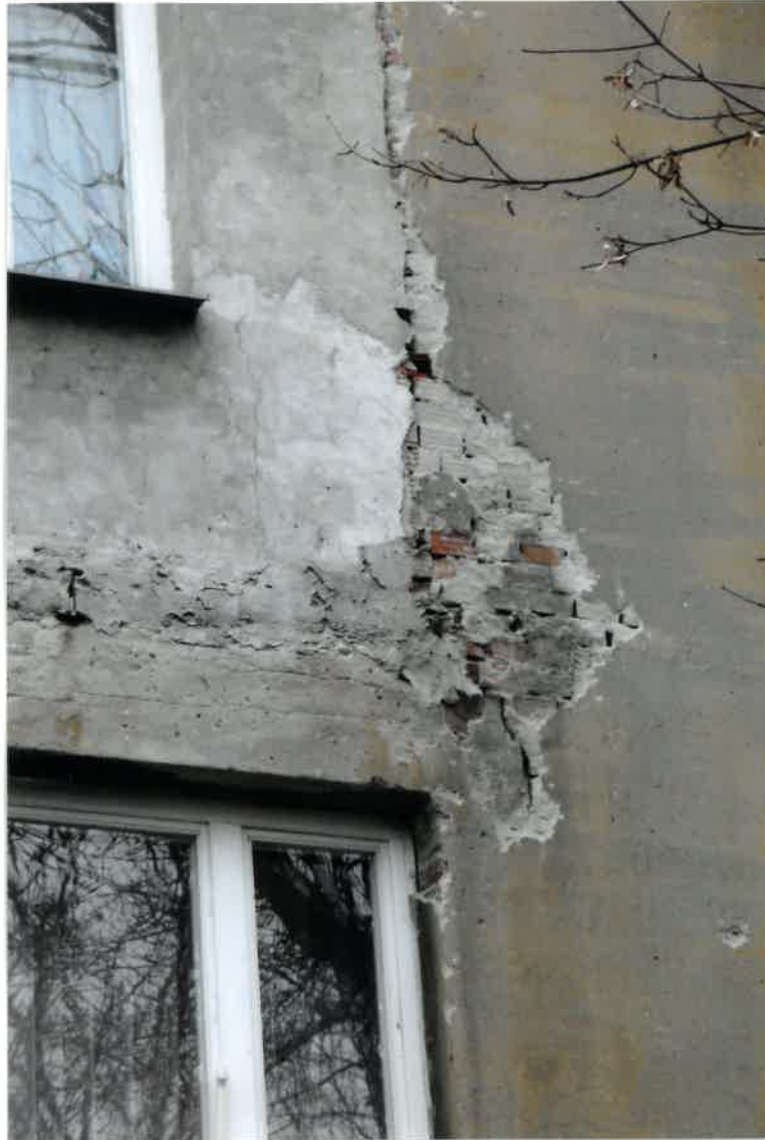
Fot. Nr 53. Widok elewacji od ulicy z widocznym pęknięciem pionowym i szczeliną w ścianie z ubytkiem zaprawy w spoinach pomiędzy ceglami, widoczne ubytki tynku na elewacji.