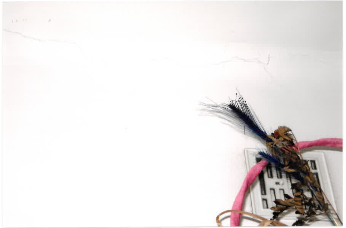
Fot. Nr 7. Pęknięcia pod stropem w lokalu nr 4/5 na parterze.