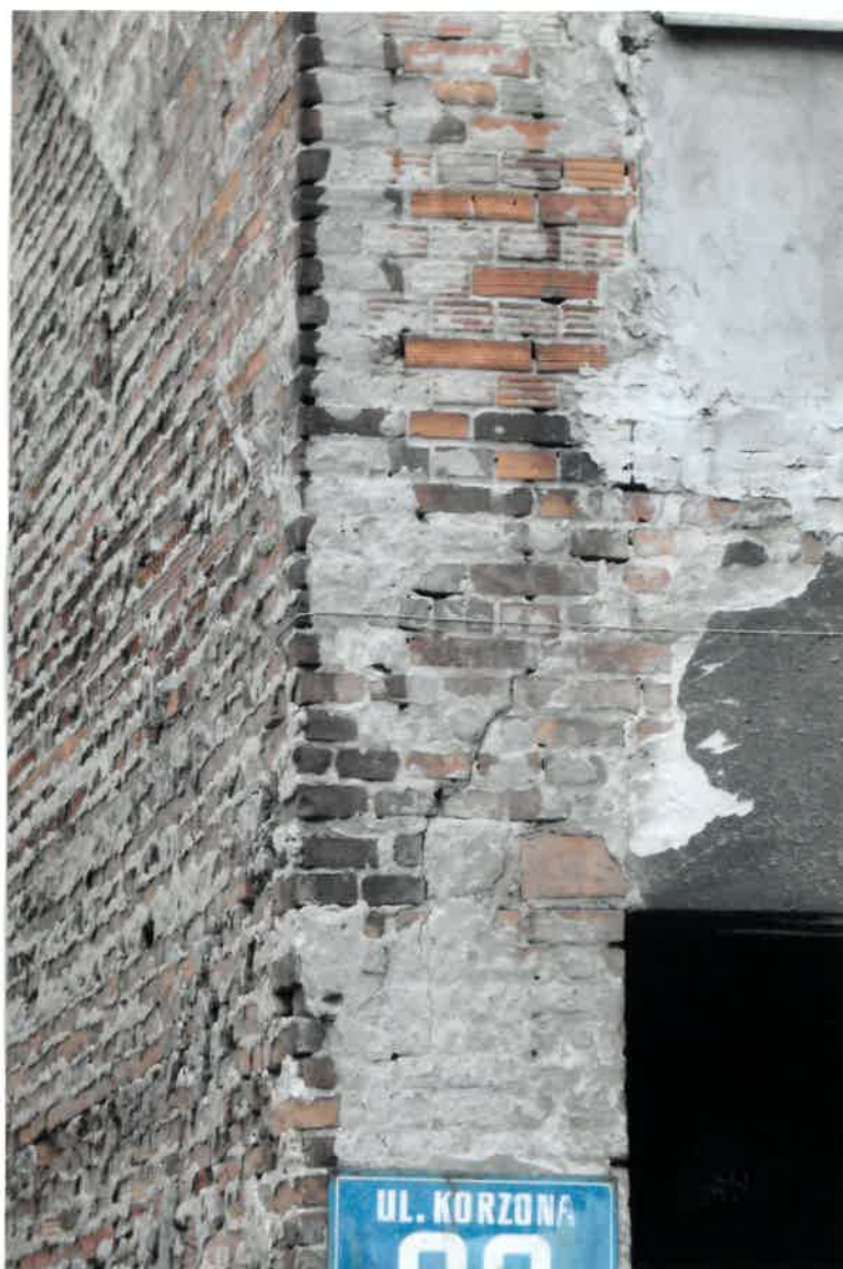
Fot. Nr 52. Widok elewacji od ulicy z widocznym pęknięciem pionowym nad ścianą prześwitu z ubytkiem zaprawy w spoinach pomiędzy ceglami, widoczne ubytki tynku na elewacji.