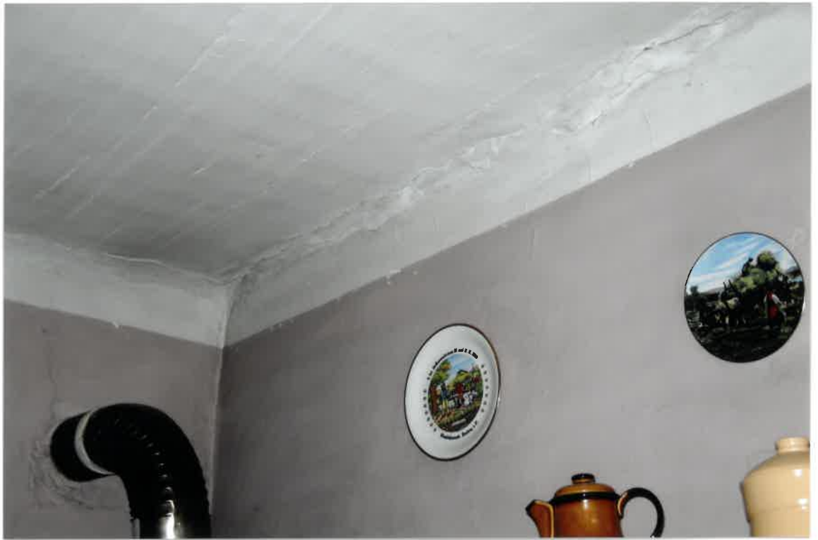
Fot. Nr 33. Pęknięcia w miejscu styku stropu i ściany w lokalu nr 9 na I piętrze.