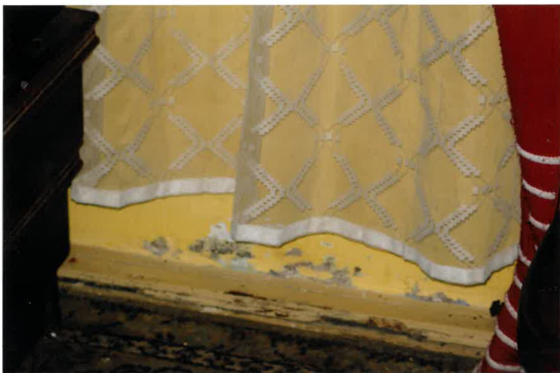
Fot. Nr 36. Ślady przemarzania ściany zewnętrznej w lokalu nr 12/13 na II piętrze.