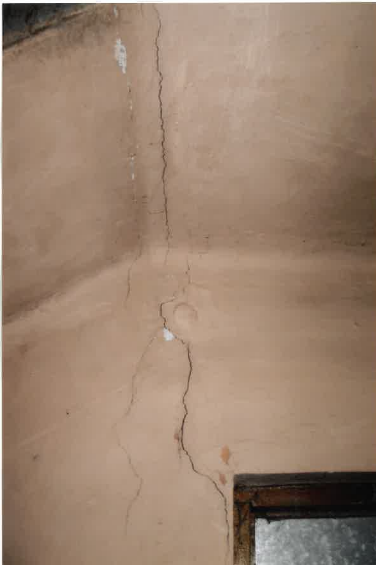
Fot. Nr 26. Pęknięcie ściany i stropu na klatce schodowej.