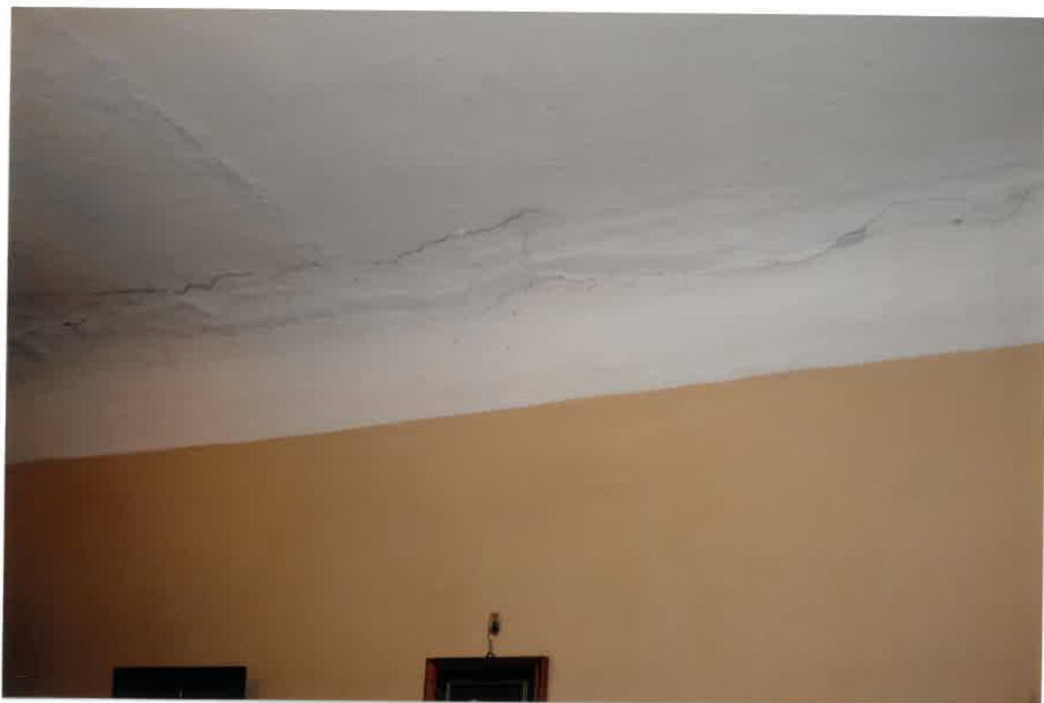
Fot. Nr 13. Pęknięcia na stropie wzdłuż belki stropowej i na styku ściany ze stropem w lokalu nr 4/5 na parterze pomieszczenie przy prześwicie budynku.