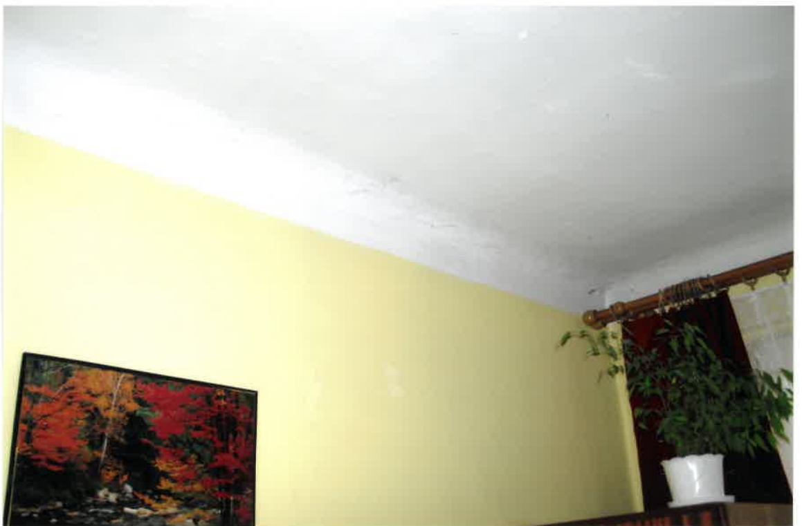
Fot. Nr 30. Pęknięcia na styku stropu ze ścianą w lokalu nr 9 na I piętrze.