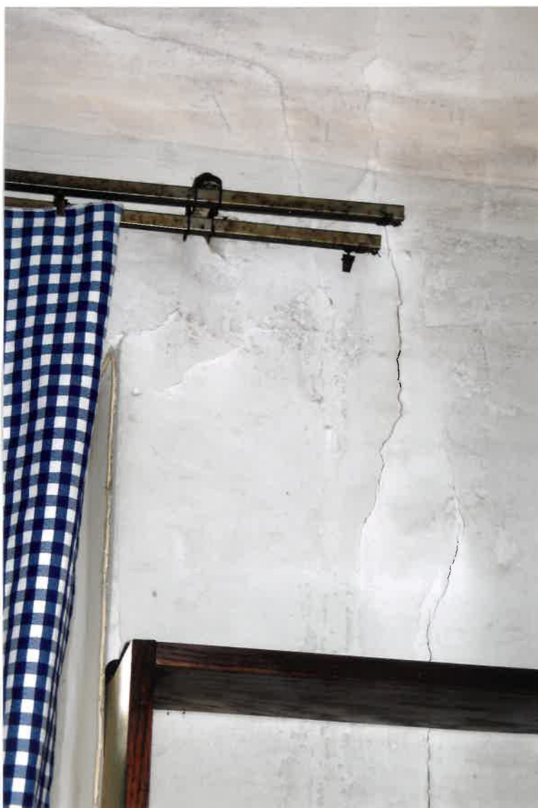
Fot. Nr 14. Pęknięcie ściany w lokalu nr 4/5 na parterze pomieszczenie przy prześwicie budynku.