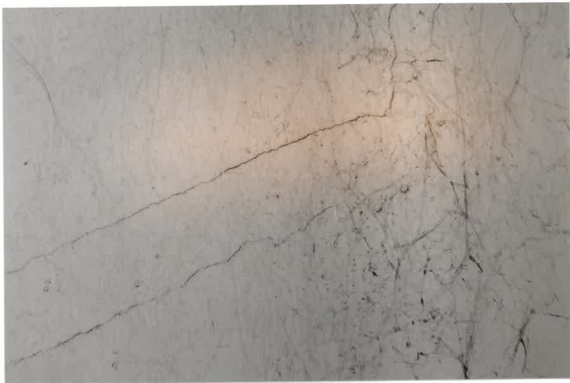
Fot. Nr 5. Pęknięcia na stropie wzdłuż belek w lokalu nr 14 na II piętrze.