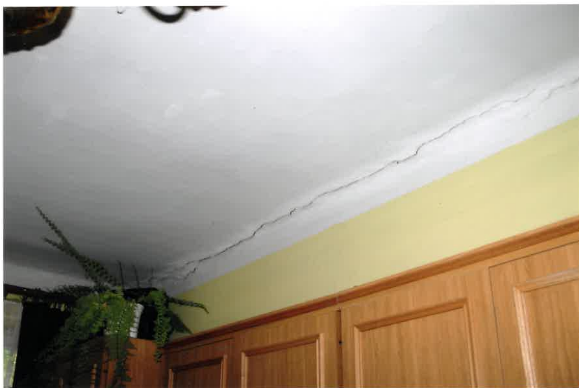
Fot. Nr 28. Pęknięcia na styku stropu ze ścianą w lokalu nr 9 na I piętrze.