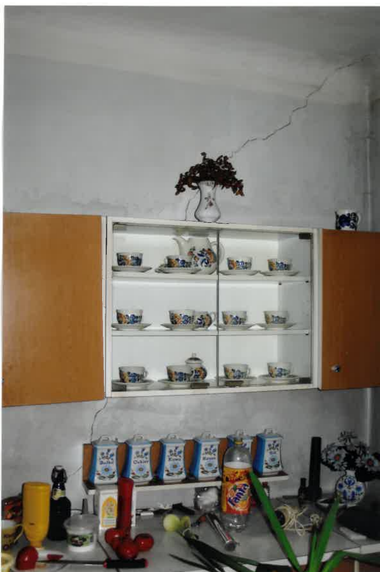
Fot. Nr 12. Pęknięcie ściany w lokalu nr 4/5 na parterze pomieszczenie przy prześwicie budynku.