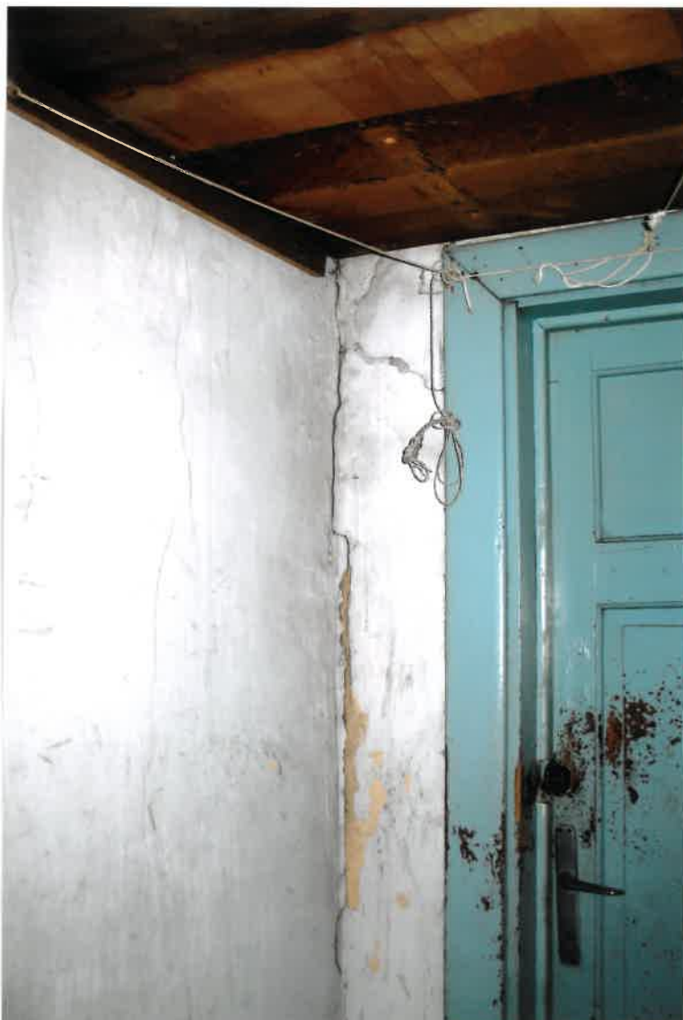
Fot. Nr 46. Pęknięcia na ścianie w narożniku na poddaszu.