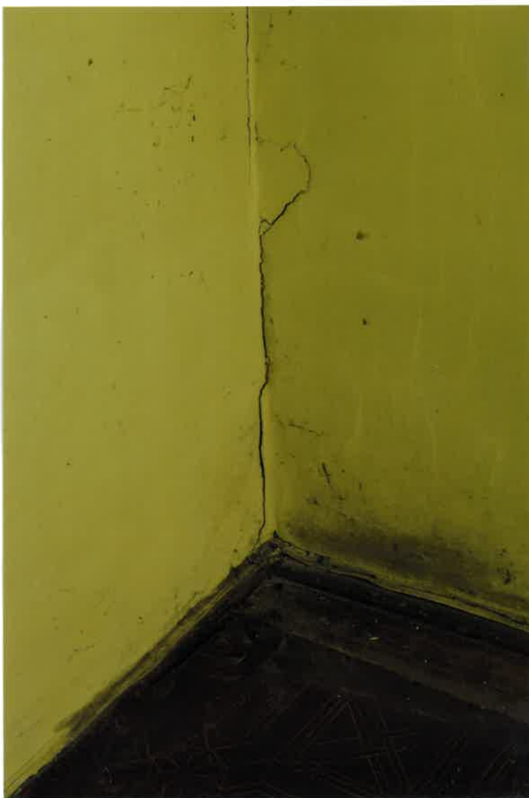
Fot. Nr 4. Pęknięcie ściany w narożniku w lokalu na I piętrze.