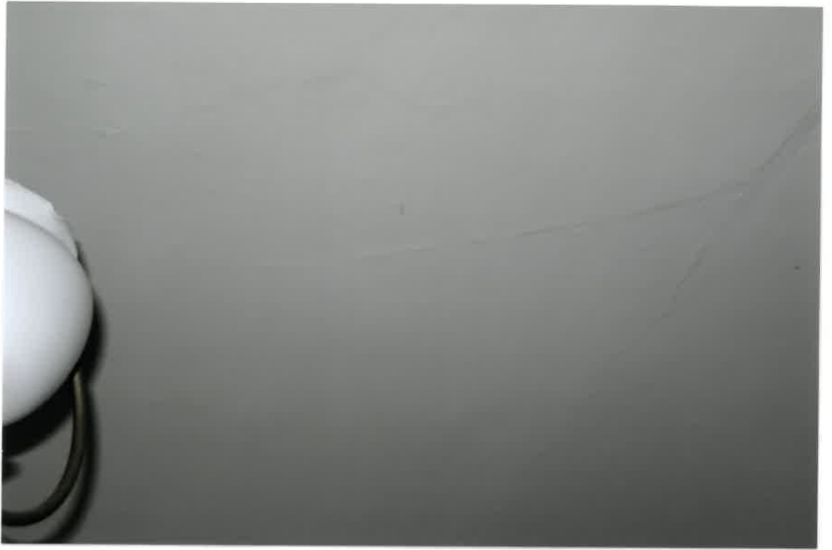
Fot. Nr 9. Pęknięcia na stropie w lokalu nr 4/5 na parterze.