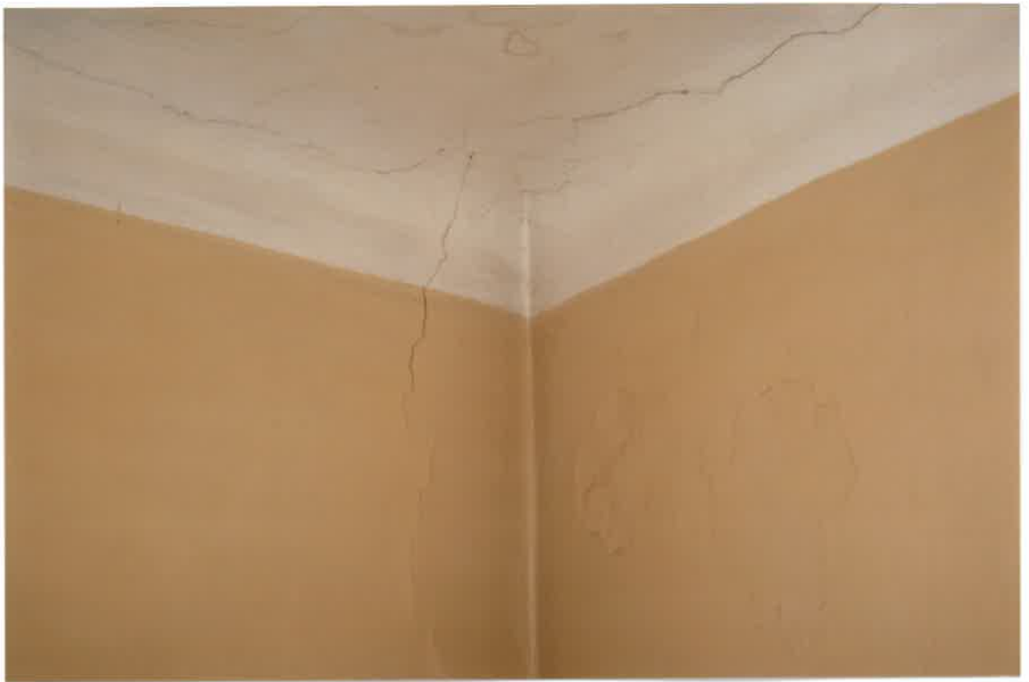
Fot. Nr 15. Pęknięcia na stropie i na ścianie w lokalu nr 4/5 na parterze pomieszczenie przy prześwicie budynku.