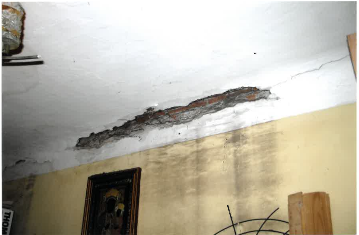
Fot. Nr 42. Pęknięcie na styku ściany ze stropem oraz pęknięcia na stropie i ubytki tynku w lokalu nr 16 na II piętrze. Widoczne ślady przemarzani ściany zewnętrznej.