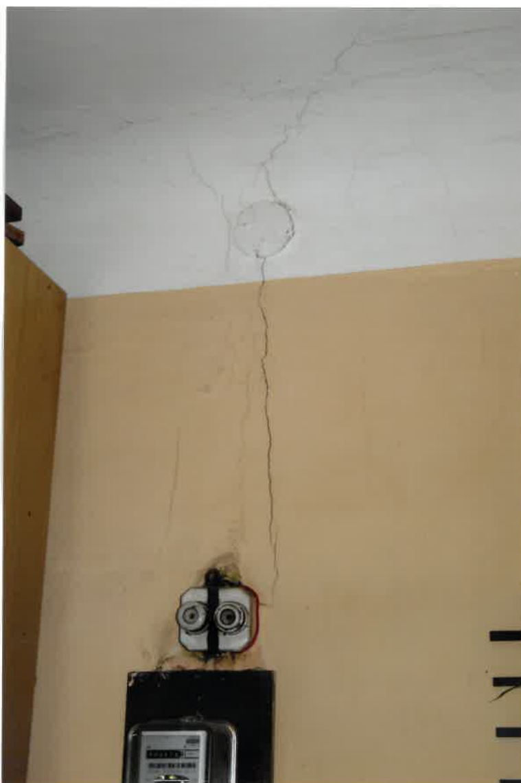
Fot. Nr 18. Pęknięcie ściany w lokalu nr 4/5 na parterze.