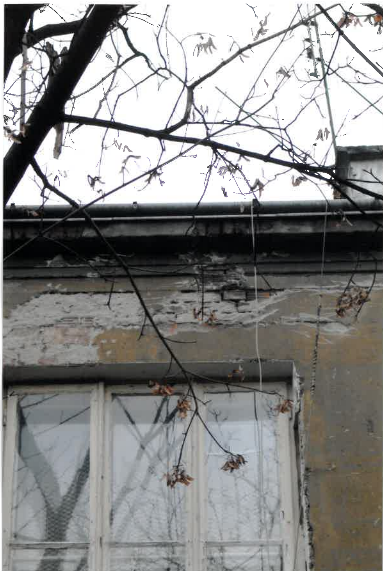
Fot. Nr 51. Widok elewacji od ulicy z widocznym pęknięciem poziomym nad oknem i ubytkiem zaprawy w spoinach pomiędzy ceglami, ubytki tynku na elewacji.