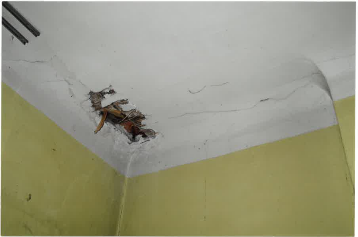
Fot. Nr 1. Spękania i ubytki w lokalu na I piętrze, widoczna trzcina. Zarysowania pod stropem i w narożach na ścianie.