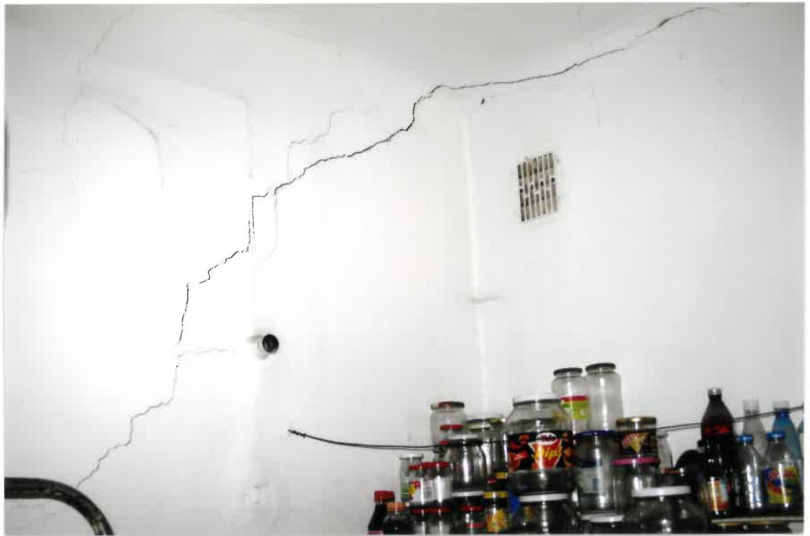
Fot. Nr 45. Pęknięcie w miejscu styku stropu i ściany zewnętrznej przechodzące na ścianę w lokalu nr 16 położonym na II piętrze nad prześwitem.