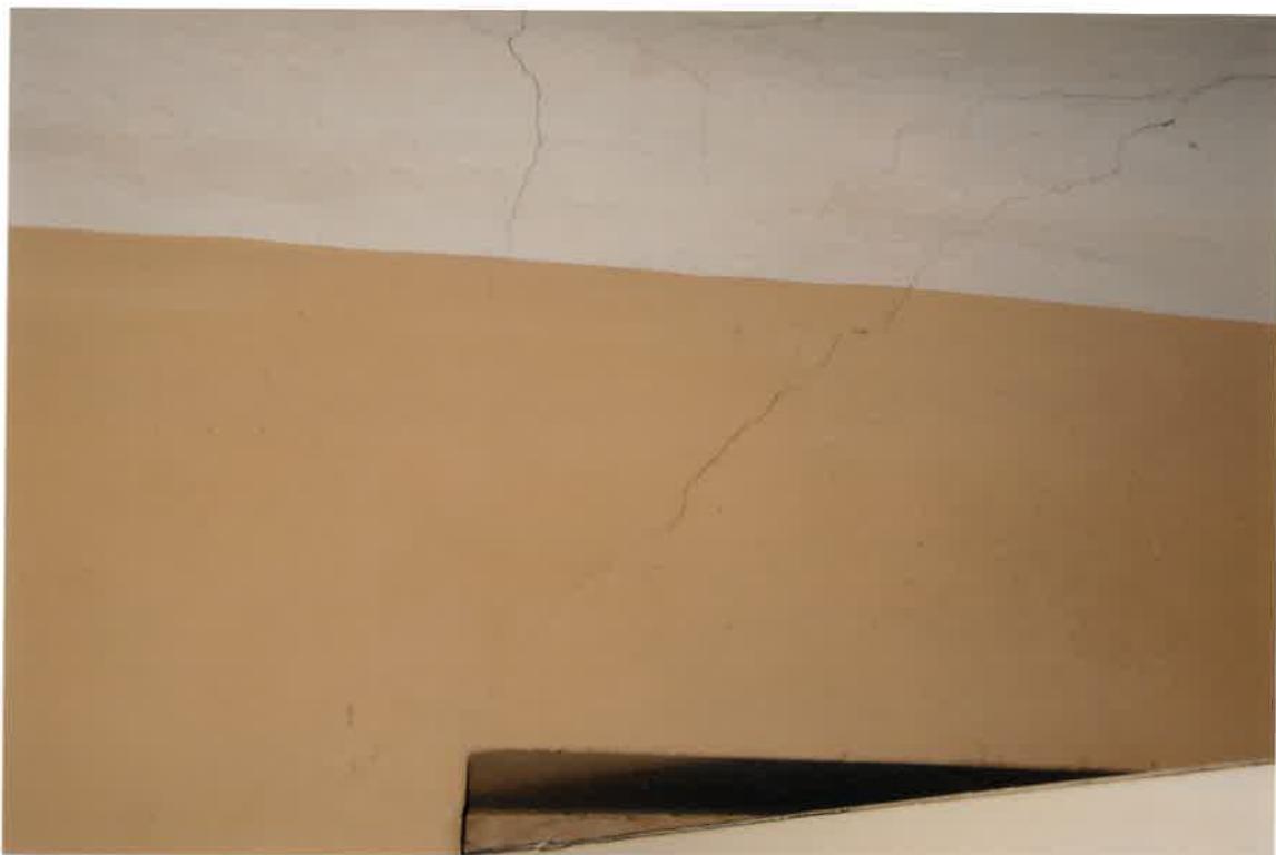
Fot. Nr 19. Pęknięcia na stropie i ścianie w lokalu nr 4/5 na parterze.