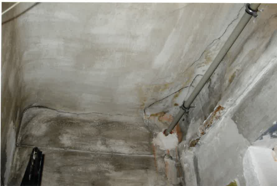
Fot. Nr 27. Pęknięcia stropu na klatce schodowej na styku ze ścianą.