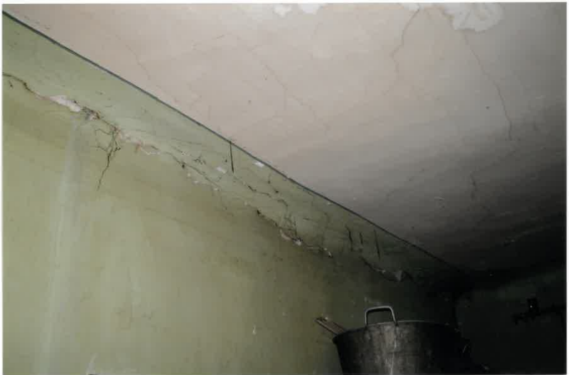
Fot. Nr 40. Pęknięcia ścian na styku ze stropem oraz pęknięcia na stropie w lokalu nr 16 na II piętrze.