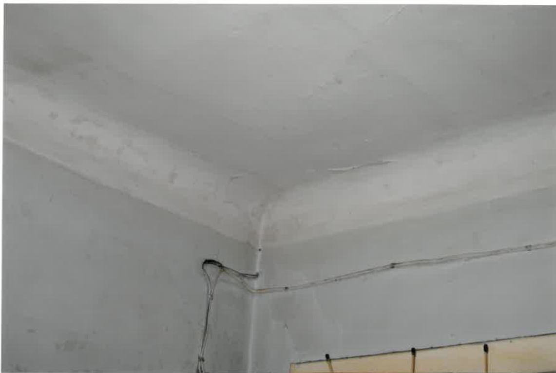
Fot. Nr 11. Pęknięcia na stropie w lokalu nr 4/5 na parterze pomieszczenie przy prześwicie budynku.