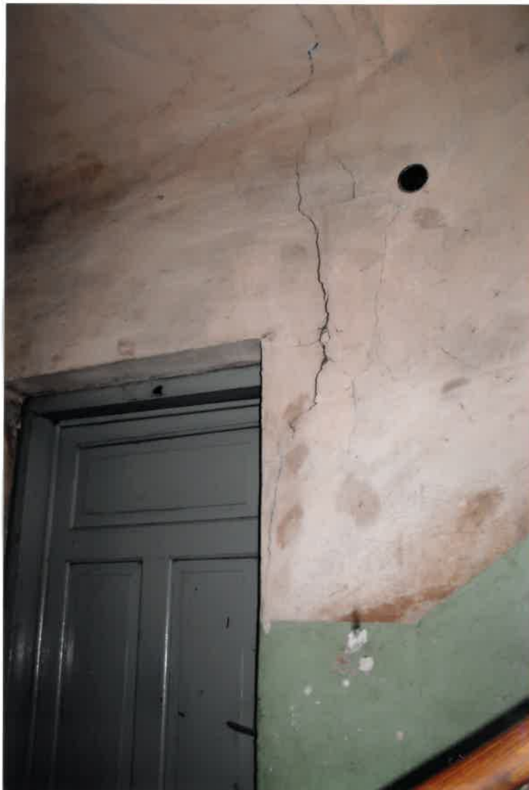
Fot. Nr 10. Pęknięcia ściany na klatce schodowej.