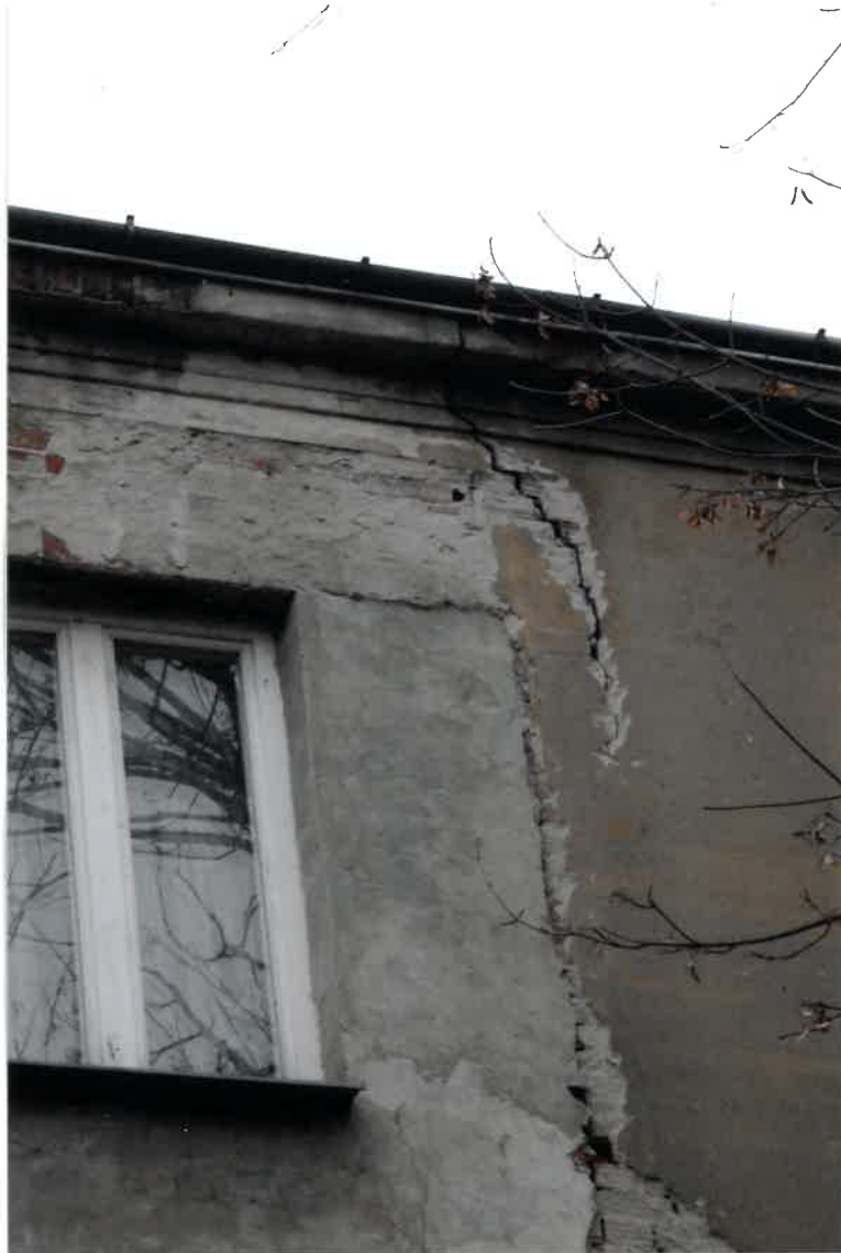
Fot. Nr 50. Widok elewacji od ulicy z widocznym pęknięciem pionowym między oknami i ubytkiem zaprawy w spoinach pomiędzy ceglami, ubytki tynku na elewacji.