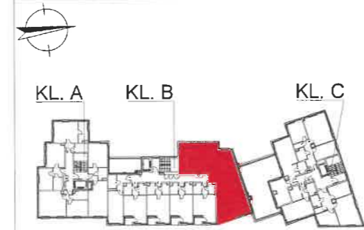
RZUT LOKALU NA KONDYGNACJI