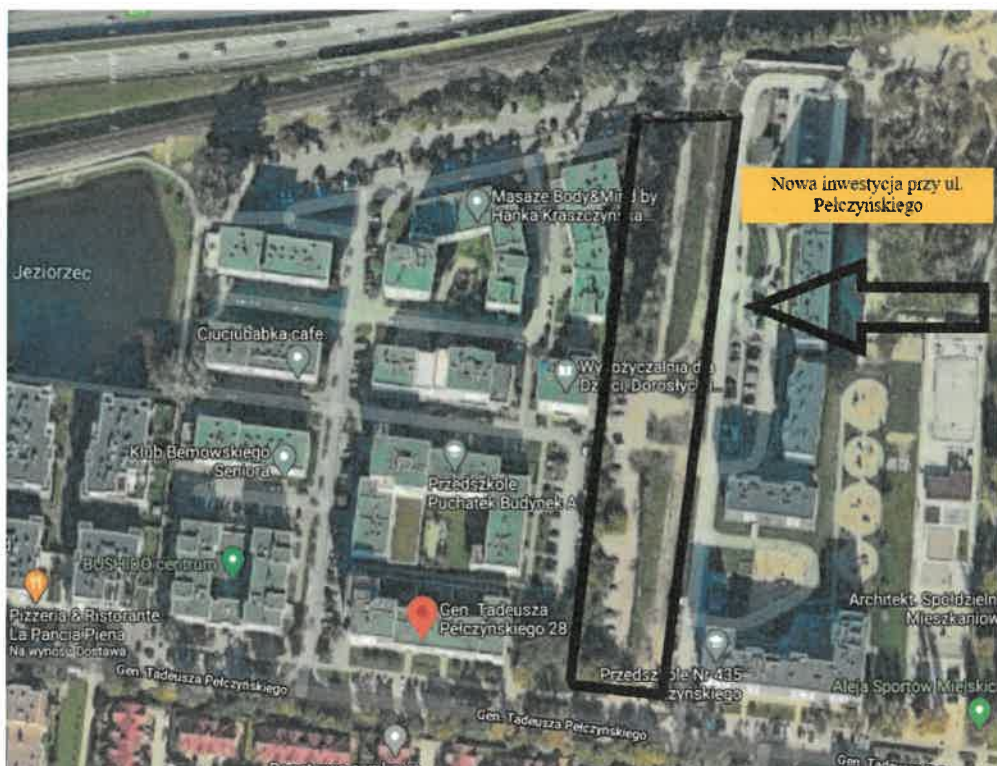
Wizualizacja 1 – lokalizacja inwestycji.

Każdy z budynków A, B i C ma kształt prostokąta o zmiennej ilości kondygnacji i posiada od 4 do 8 pięter. Najwyższe kondygnacje są w budynku A od strony ul. gen T. Pełczyńskiego oraz w budynku C od strony trasy S-8. W każdej klatce schodowej zainstalowana jest winda.