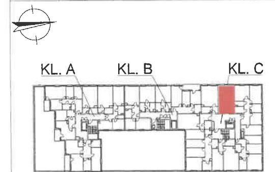
RZUT LOKALU NA KONDYGNACJI