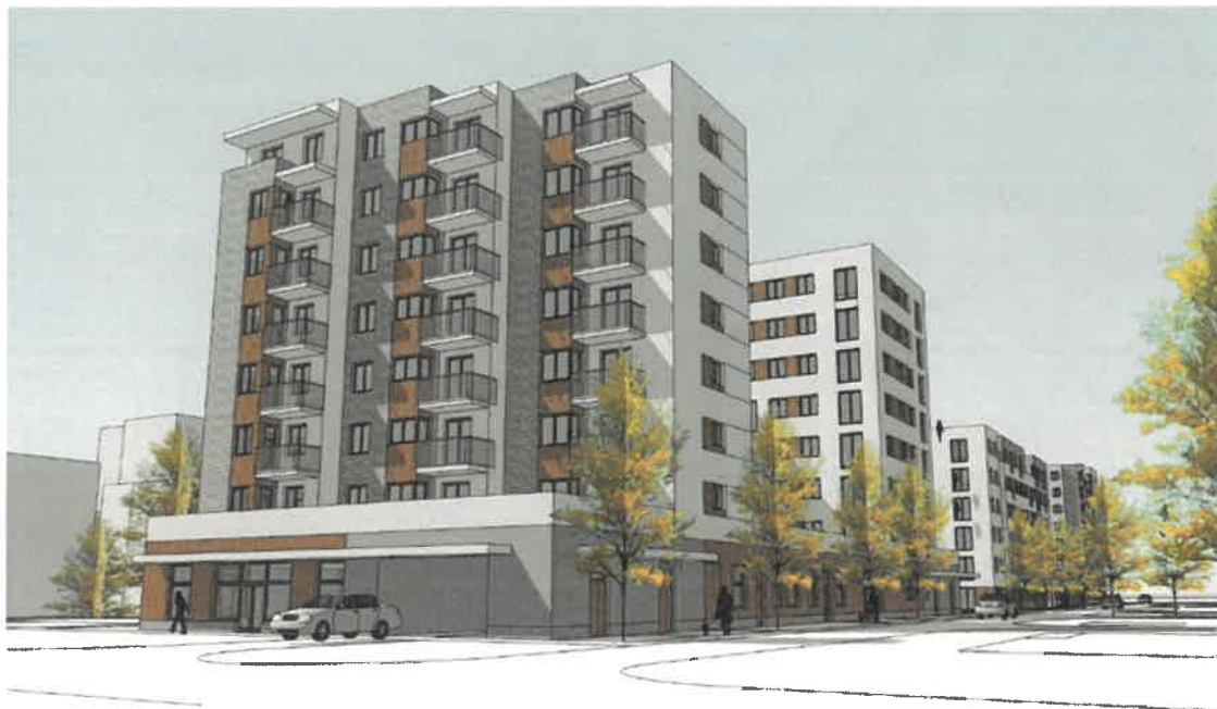
Wizualizacja 2 – elewacja południowo-wschodnia od ul. gen. T. Pełczyńskiego (Budynek A i B).