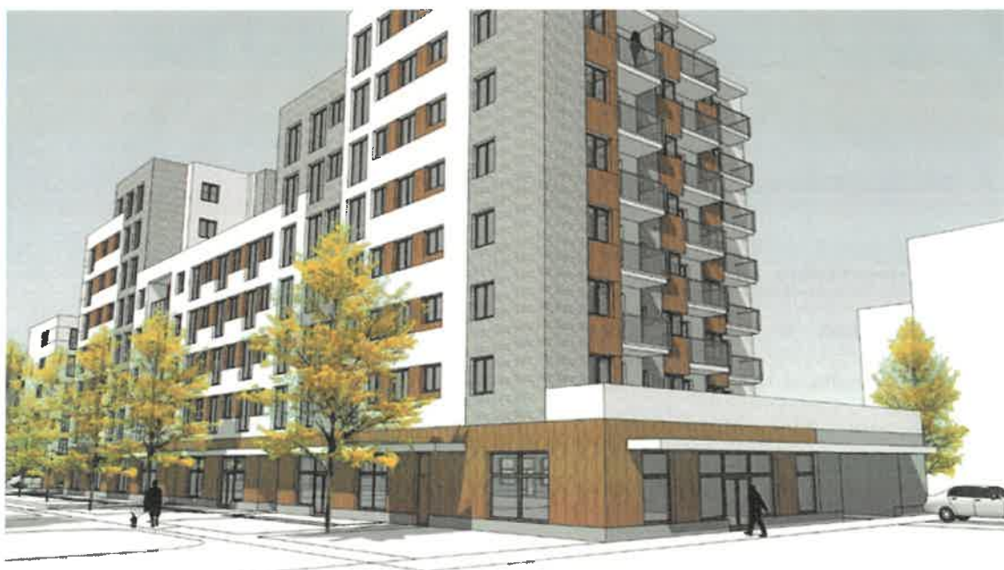
Wizualizacja 3 – elewacja południowo-zachodnia od ul. gen. T. Pełczyńskiego (Budynek A i B).