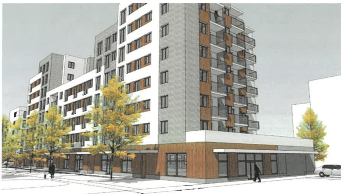
Wizualizacja 3 – elewacja południowo-zachodnia od ul. gen. T. Pełczyńskiego (Budynek A i B).