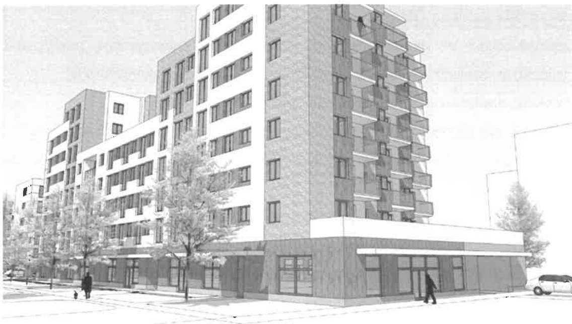
Wizualizacja 3 – elewacja południowo-zachodnia od ul. gen. T. Pełczyńskiego (Budynek A i B).