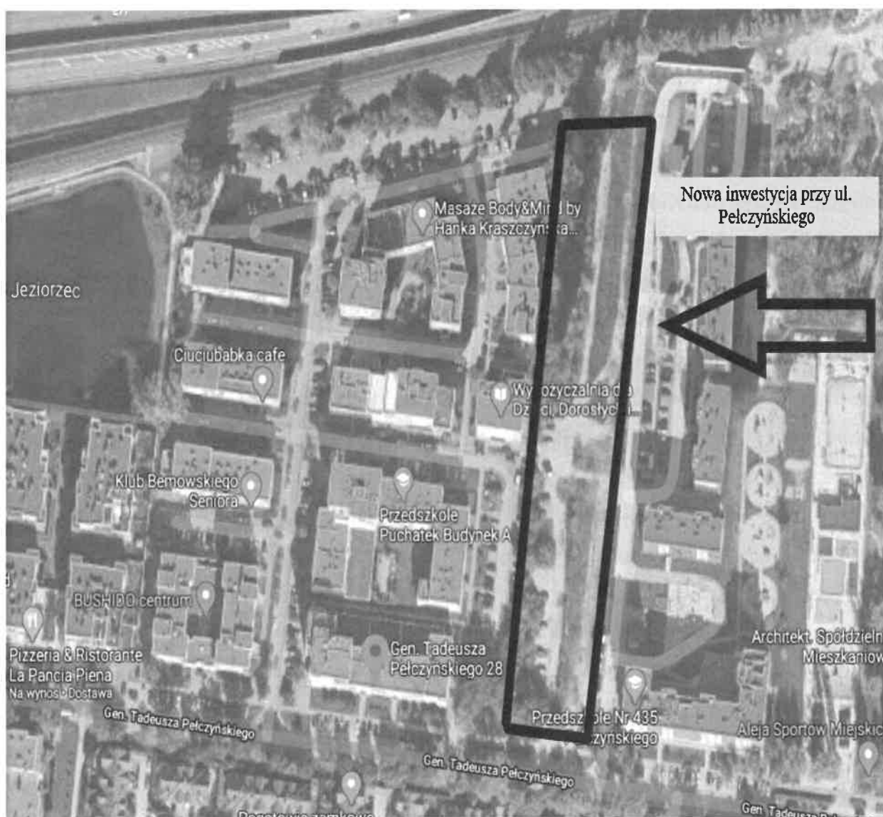
Wizualizacja 1 – lokalizacja inwestycji.

Każdy z budynków A, B i C będzie miał kształt prostokąta o zmiennej ilości kondygnacji i będzie posiadał od 4 do 8 pięter. Najwyższe kondygnacje zaprojektowane są w budynku A od strony ul. gen T. Pełczyńskiego oraz w budynku C od strony trasy S-8. W każdej klatce schodowej będzie zainstalowana winda.