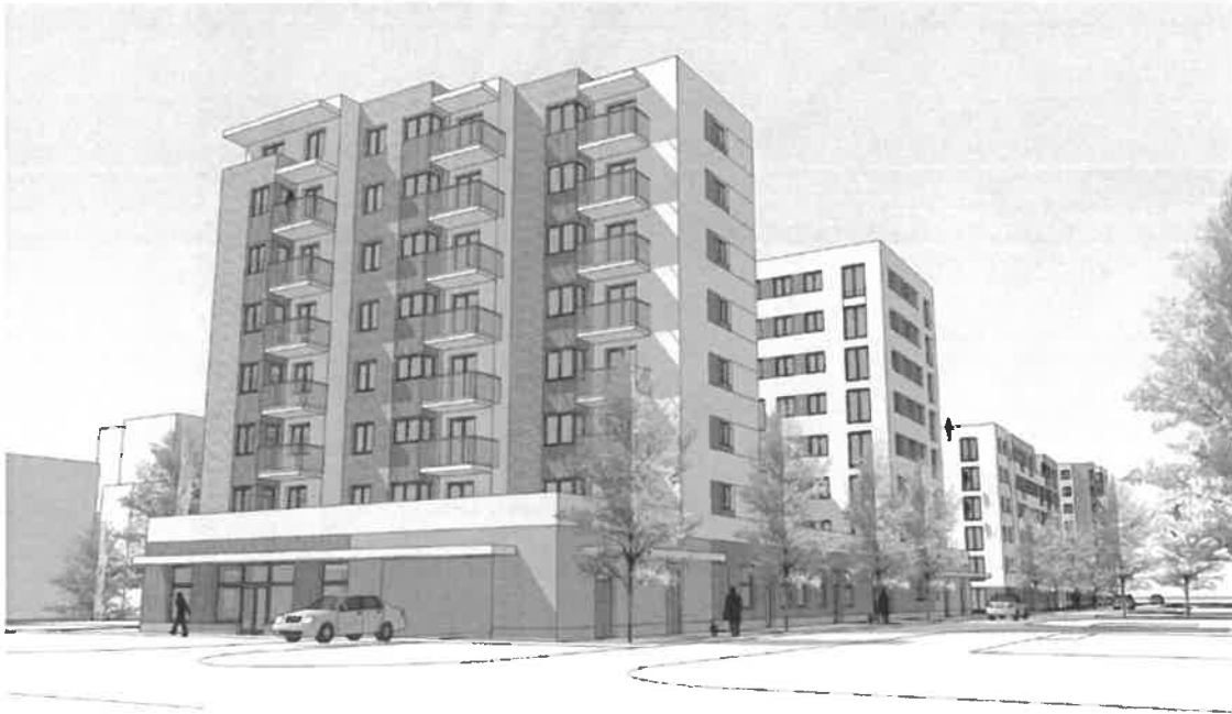
Wizualizacja 2 – elewacja południowo-wschodnia od ul. gen. T. Pełczyńskiego (Budynek A i B).