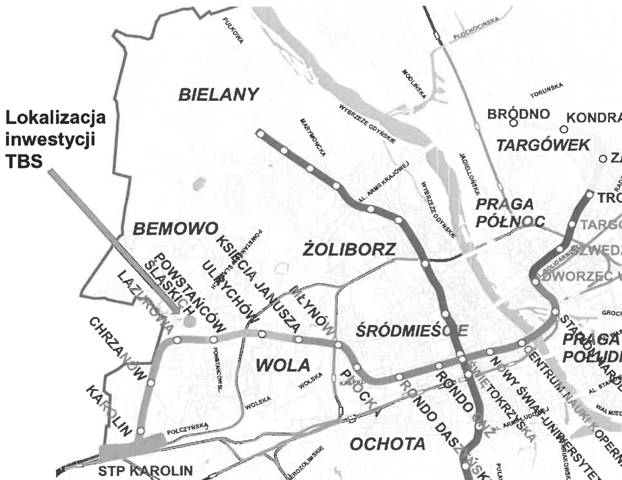
Wizualizacja 4 – lokalizacja inwestycji względem II linii metra.