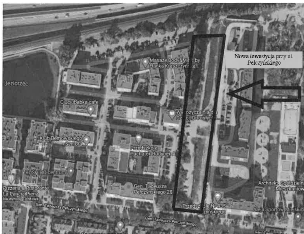
Wizualizacja 1 – lokalizacja inwestycji.

Każdy z budynków A, B i C ma kształt prostokąta o zmiennej ilości kondygnacji i posiada od 4 do 8 pięter. Najwyższe kondygnacje są w budynku A od strony ul. gen T. Pełczyńskiego oraz w budynku C od strony trasy S-8. W każdej klatce schodowej zainstalowana jest winda.